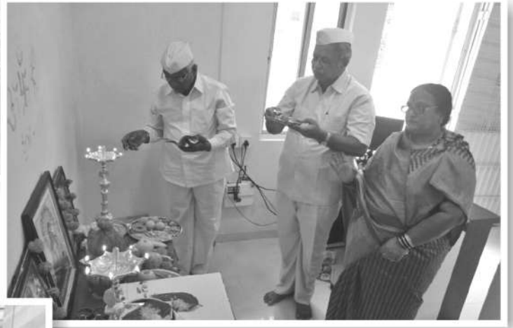
सांगली शाखा वर्धापन दिनानिमित्त शांतिक पूजे प्रसंगी संचालक व कर्मचारी वर्ग.