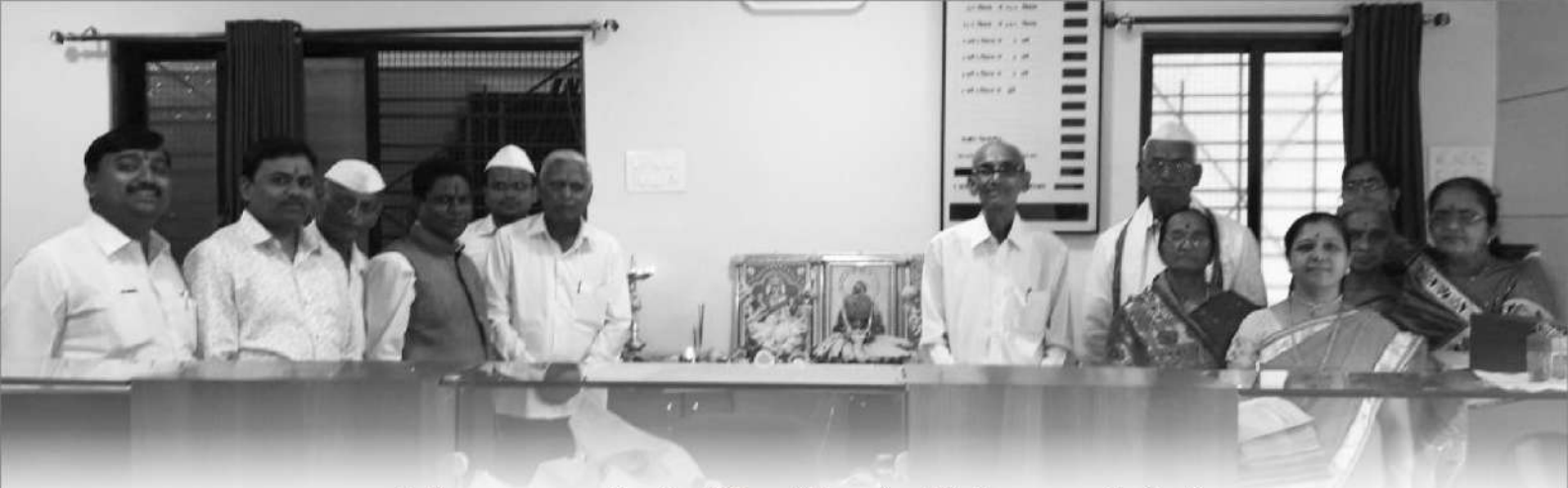
सांगली नाका शाखा वर्धापन दिनानिमित्त शांतिक पूजे प्रसंगी संचालक व कर्मचारी वर्ग.