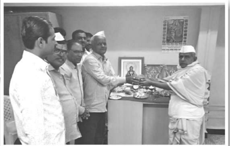
जयसिंगपूर शाखा वर्धापन दिनानिमित्त शांतिक पूजे प्रसंगी संचालक व कर्मचारी वर्ग.