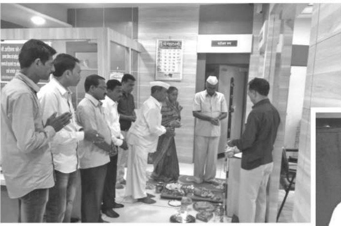
कबनूर शाखा वर्धापन दिनानिमित्त शांतिक पूजे प्रसंगी संचालक व कर्मचारी वर्ग.