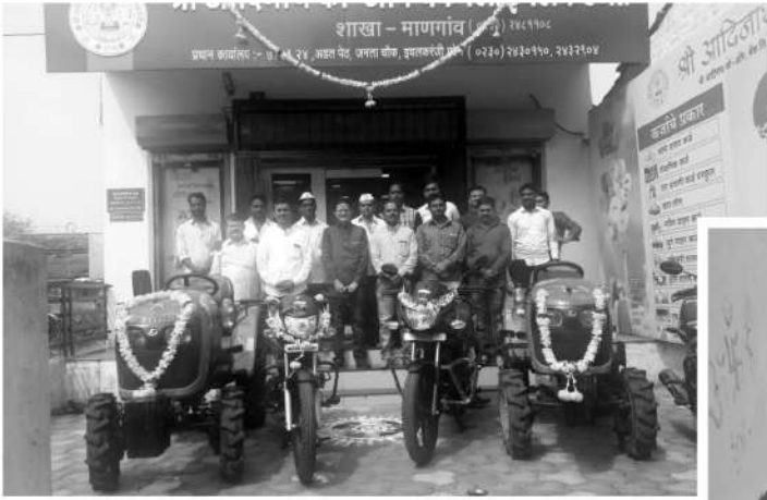
माणगांव शाखेत वाहन तारण कर्जदारांना दुचाकी व ट्रॅक्टर प्रदान करताना संचालक व स्टाफ.